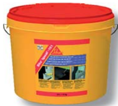
Balení: 5 l, 12 l kbelík