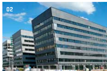
02 &gt; Prosek Point, Praha