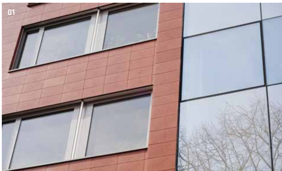
01 &gt; Bytový dům, Brno